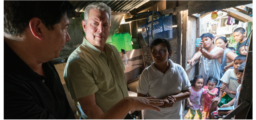
إخراج: بوني كوين وجون شينك