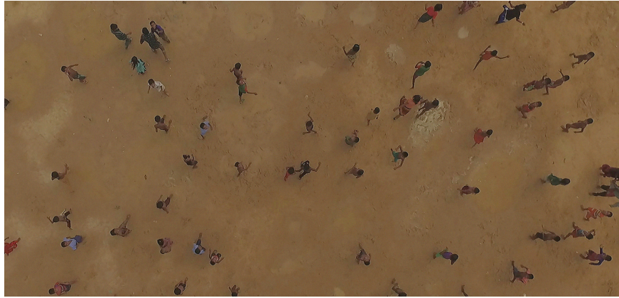
إخراج: آي واي واي