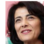
هيام عباس ممثلة وكاتبة ومخرجة/ فلسطين