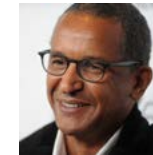
عبد الرحمن سيساكو مخرج ومنتج/ موريتانيا