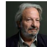
محمد ملص مخرج/ سوريا