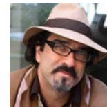
عتيق رحيمي مؤلف ومخرج/ أفغانستان، فرنسا