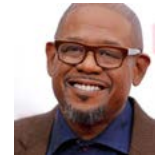
فوريسيت ويتكر ممثلة/ أمريكا