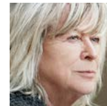
مارجريت فون تروتا ممثلة وكاتبة سيناريو ومخرجة/ ألمانيا