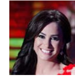
هند صبري ممثلة/ تونس، مصر