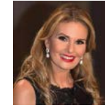
يُسرا ممثلة/ مصر